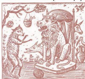
Εικ. 1. Λιοντάρι, λύκος κι αλεπού. (λαϊκό παραμύθι)

Ελληνικά Παραμύθια εκλογή του Γ.Α. Μέγα, τομ.Α, τομ.Β (εκδ. Εστία Ι.Δ.Κολλάρου)